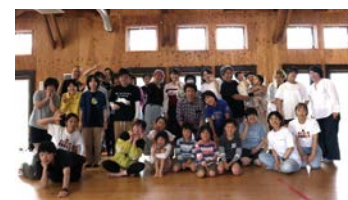
劇場で多様な交流が生まれました