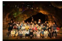
終演後、最後の全員集合