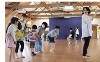
チーム対抗ジェスチャーゲーム