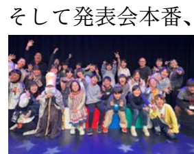
終演後、達成感に満ちた表情のジュニアクラスメンバーとスタッフ

秋から冬にかけては、色んな創作方法に挑戦しました。「転校生がやってきた」というテーマで、ユニークな設定の物語を創作。また、2,3人の小さなチームに分かれ、それぞれが劇作と演出をローテーションで挑戦し、2時間でなんと11本もの劇を発表しました。また、大人の俳優が「一番輝く」物語をこども達が作演出したり、設定やセリフを駆使する「俳優を椅子から立たせる」プログラム、現実のエピソードから劇を立ち上げる作り方など、メキメキと創作力を育み、更に演劇を楽しむ姿が見られました。年明けからは、2月の発表会を見据えた活動が始まり、手応えのある作品が生まれ、大人も驚くほど順調に稽古が進みました。