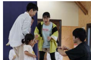
みんなでジャンケンゲーム

上げる過程で、スタジオには真剣さと笑い声が溢れました。最初は保護者のそばを離れなかった子どもたちも、後半にはすっかりチームの一員。大学生や大人たちと肩を並べて演劇の世界に没頭する姿が印象的でした。「演劇は何歳からでも、誰とでも楽しめる」。参加者の皆さんの生き生きとした表情は、そんな演劇の可能性を物語っていました。共に創り上げる喜びを分かち合った実りある一日となりました。参加いただいた皆様ありがとうございました！