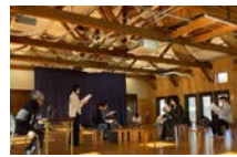
台本を使って立ち稽古開始

本番が近づく頃には冬休みも終わり、放課後に劇場へ通いながら学校生活と両立する姿に、頼もしさを感じました。