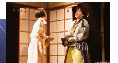
江原河畔劇場→東京公演「反芻動物」による『紙風船』舞台写真