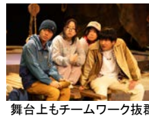
舞台上もチームワーク抜群