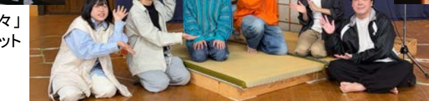
『紙風船』ワークインプログレスを終えて交流するアソシエイトカンパニー「時々」「反芻動物」メンバーのみなさん