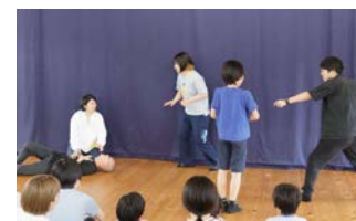
ジェスチャー創作劇を発表