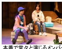
本番で堂々と演じるメンバー

そして迎えた本番では、全6公演、どの回も、児童劇団メンバーのご家族や友人、学校の先生、地域の方々、大学生など、多くの方にご来場いただき、客席は温かな空気に包まれました。千秋楽のカーテンコールでは、出演者が3回目をフライングしてしまうほど、やり切った様子を見せていました。幸い流行病などで欠席者が出ることなく、第5期メンバー全員で舞台を終えることができました。今期で最後の参加となるメンバーもあり、これまでの活動をみんなで振り返りながら幕を閉じました。旅立つ仲間を見送りつつ、たじま児童劇団はこれからも挑戦を続けていきます。